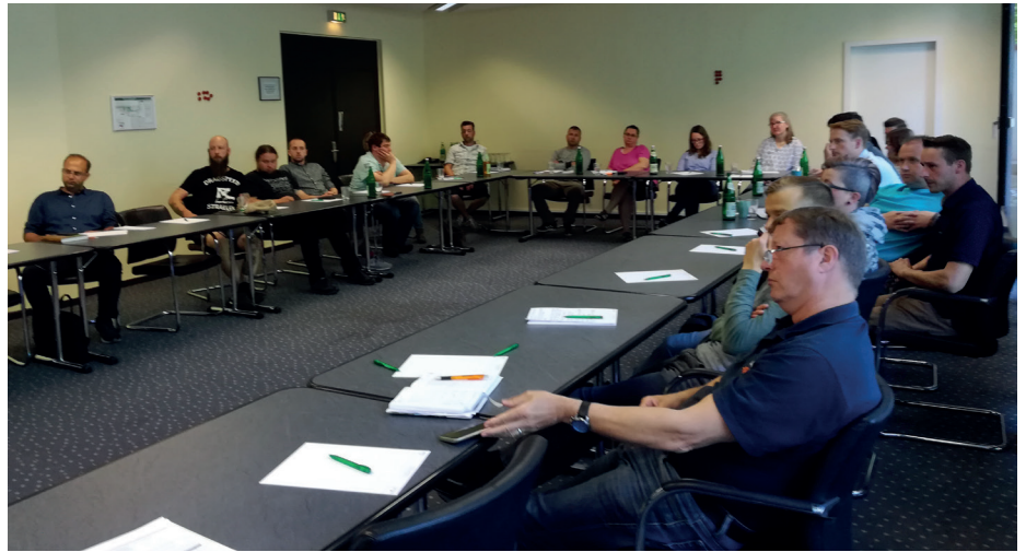
Die Teilnehmer der Ausbildung Fachkraft Kartoffel diskutieren aktuelle Fragen.

Wie viele andere Branchen auch, wirbt die Kartoffelwirtschaft um qualifizierten Nachwuchs und Fachkräfte. Mit einer branchenspezifischen Aus- und Weiterbildung, die der Deutsche Kartoffelhandelsverband e.V. organisiert und anbietet, erhalten insbesondere Neu- und Quereinsteiger auf die Belange und Anforderungen der Kartoffelwirtschaft ausgerichtetes Wissen vermittelt. In einem insgesamt 4-tägigen Kurs werden die Themen Warenkunde, Züchtung, Acker- und Pflanzenbau, Ernte und Kartoffellagerung, Kartoffelgesundheit, Qualitätssicherung und -management sowie gesetzliche Regelungen – gekoppelt mit praktischen Übungen – vermittelt. Erfahrene Lehrsachverständige und Dozenten leiten die Ausbildung.