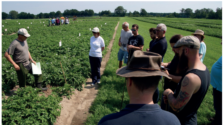
Herr Tschentscher von der LWK Niedersachsen unterweist die Teilnehmer in der Virusan- sprache.

Im praktischen Ausbildungsteil in Suderburg begrüßte Herr Dr. Tschentscher die Lehrgangsteilnehmer und informierte zunächst über Aufbau und Aufgabe des Schulungsfeldes. Anschließend konnten die Teilnehmer auf einem Rundgang mit Ansprache von Sortenmerkmalen und Krankheitssymptomen an ca. 100 verschiedenen Kartoffelsorten (Parzellen mit Züchterneubezug und Nachbau) ihr theoretisch