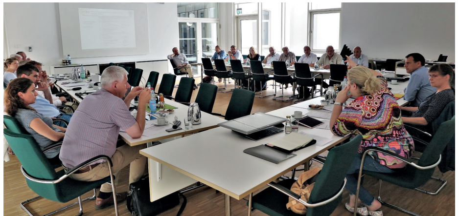
Teilnehmer und Gäste der gemeinsamen Gremiensitzung der Fachkommission Qualitätssicherung und Handelsfragen sowie des Ausschusses Handel, Qualität und Ökologie.

Ergänzend wurden aktuelle Entwicklungen im Bereich Wirkstoffe und Pflanzenschutzmittel erörtert, insbesondere die Situation bei den Mitteln zur Wahrung der Keimruhe. Noch in der Sitzung erreichte die Teilnehmer die Nachricht der Europäischen Kommission zur Nichterneuerung der Genehmigung für den Wirkstoff Chlorpropham (CIPC). Die Entscheidung der EU-Kommission stützt sich auf die Schlussfolgerungen der EFSA zu diesem Wirkstoffstoff. Bis spätestens 8. Januar 2020 müssen die Mitgliedstaaten die Zulassungen für Pflanzenschutzmittel, die Chlorpropham als Wirkstoff enthalten, widerrufen. Zudem müssen die von den Mitgliedstaaten eingeräumten Aufbrauchfristen so kurz wie möglich sein und spätestens am 8. Oktober 2020 enden. Derzeit argumentiert die europäische Kartoffelwirtschaft für einen Antrag auf Erlangung eines vorübergehenden Rückstandshöchstgehalts für Chlopropham. Dieser ist erforderlich, da CIPC auch nach intensiver Reinigung