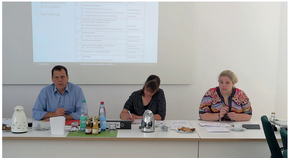
UNIKA- und DKHV-Gremiensitzung in Hannover.